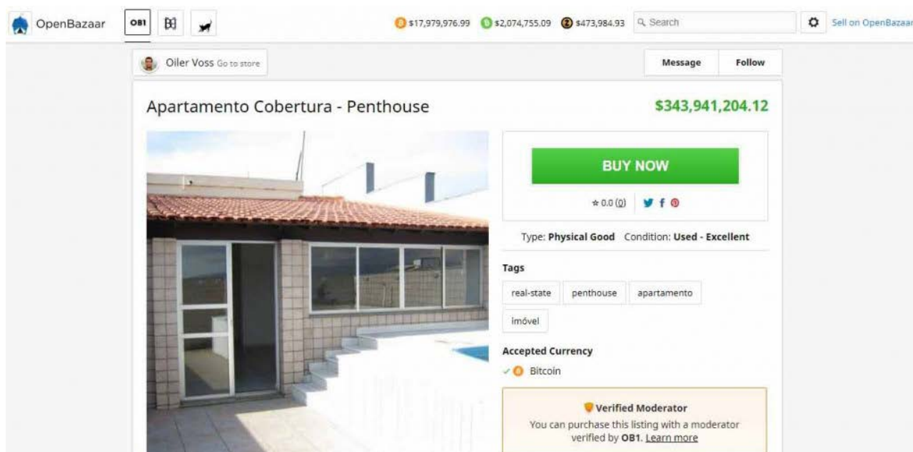
Publicación del usuario Oiler Voss para la venta del apartamento.

Este parece ser el caso del usuario Euler Alves, un comerciante residente en Brasil conocido bajo el nombre de usuario Oiler Voss , quien a través de la plataforma OpenBazaar tomó la decisión de poner a la venta su apartamento ubicado en la ciudad de Contagem por un valor aproximado de 20 BTC (USD $123.000 / BRL 344.000.000).